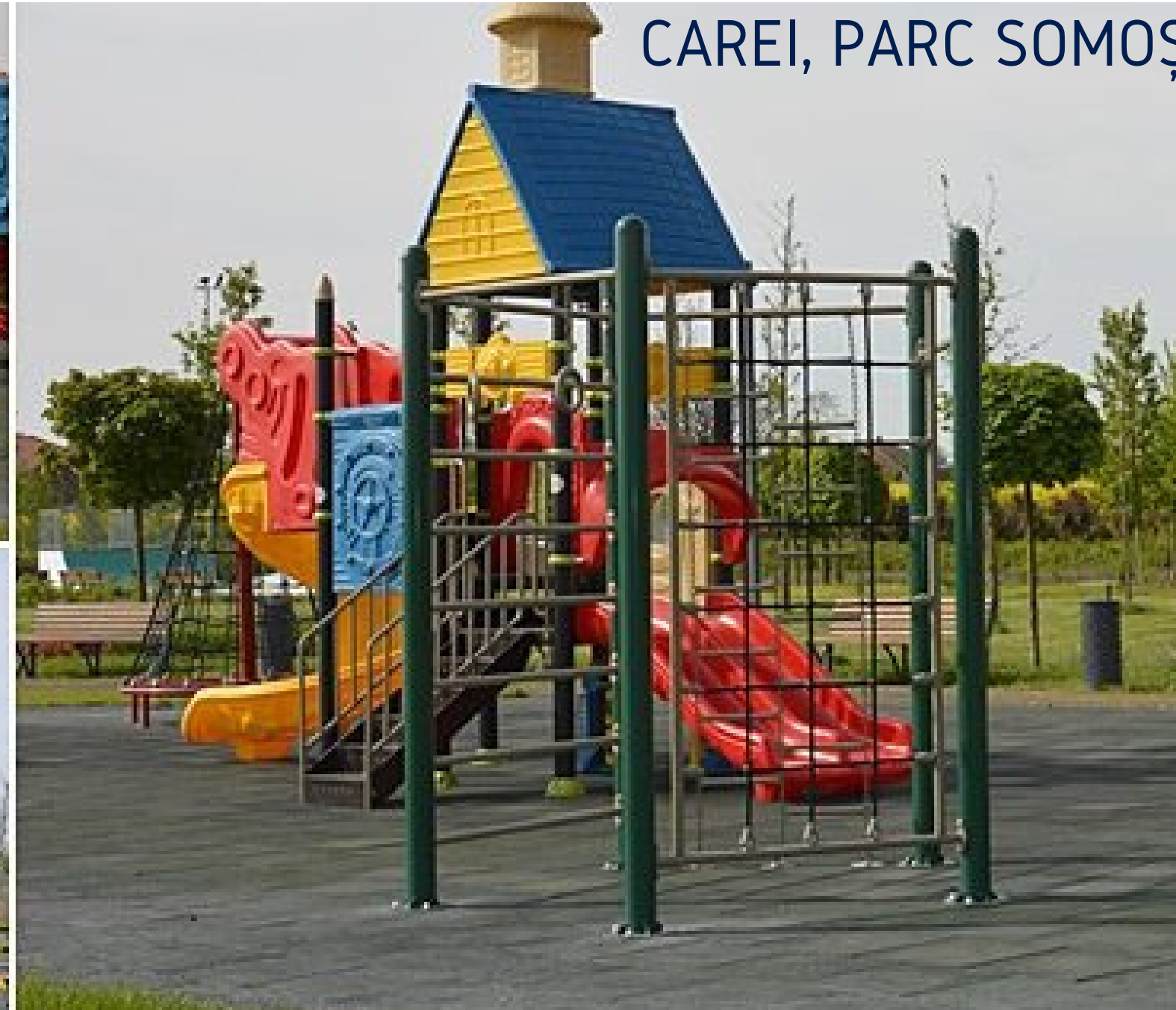
CAREI, PARC SOMOȘ

Situația dorită: Locuri de joacă cu echipamente noi, moderne, împrejurite corespunzător, care pot fi folosite în siguranță de copii, în special în cartiere